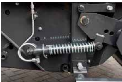
De pickup die op spiraalveren steunt, zorgt samen met de kortgewasrol voor een gelijkmatige invoer van het gewas.