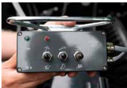
De elektrohydraulische bediening geschiedt via de PilotBox-T.