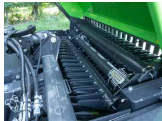
Alle smeerpunten van de invoer bevinden zich op de centrale as.

De hydraulische bodemketting verplaatst het gewas snel en krachtig naar achteren. Dit zorgt ervoor dat het laadvolume tot in de laatste hoek wordt benut. De bodemketting is naast de bediening vanuit de trekker ook aan de achterkant van de opraapwagen te bedienen.