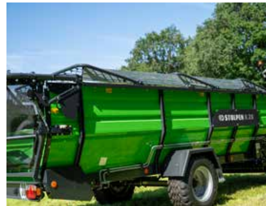
Hydraulische neerklapbare bovenbouw standaard.