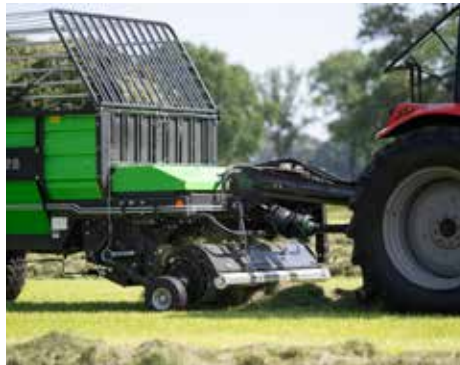
De pick-up is voorzien van 5 gestuurde tandbalken.