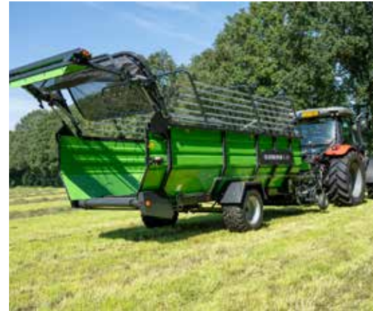
Snel lossen wordt mogelijk gemaakt door de hydraulisch bediende, achterklep, die vanuit de cabine van de trekker kan worden geopend.